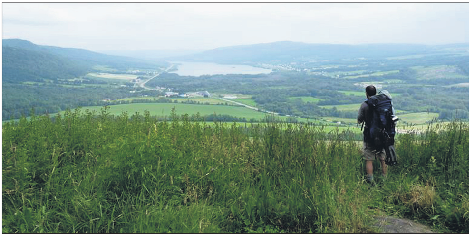
Simon Bourk vient de s'élancer sur les montagnes du Main, première étape de la portion américaine du Sentier international des Appalaches.

Un bon nombre d'animaux ont aussi été du lot. Le plus impressionnant de tous consiste en un ours noir. «Soudainement, il a levé ses yeux et m'a vu. J'ai vu dans ses yeux la frayeur d'un animal en détresse... la mort à ses trousses. Il a déguerpi sans perdre une seconde», écrit Simon Bourk dans son carnet de voyage. ■